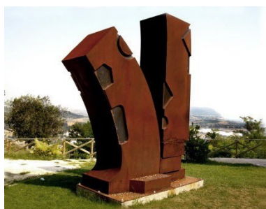
2009 - Loreto, Giardini di Porta Marina Pellegrini , acciaio corten, cm h 400 x 250 x 140