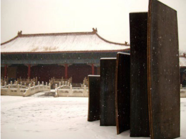
2010 - Tianjin, Istituto Italiano di Cultura Letteratura II , acciaio corten, cm 300 x 400 x 150