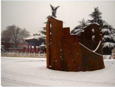
2011 - Rongcheng - Shandong Fortezza II , 2010, acciaio corten, cm h 440 x Ø 500