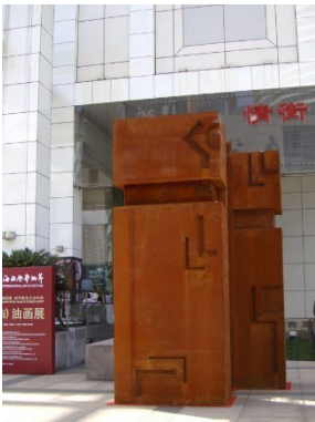
2010 - Shanghai, Sculpture Park Legami II , acciaio corten, piombo, cm 350 x 250 x 460