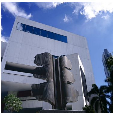
2010 - Miami, Dade College La Vittoria di Samotracia , 2010, acciaio corten, cm 280 x 250 x 130