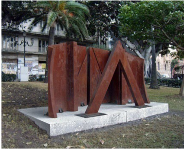
2010 - Reggio Calabria, Lungomare Italo Falcomatà Monumento al Mediterraneo , 2006, grès, ossido di ferro, cm h 190 x 405 x 200