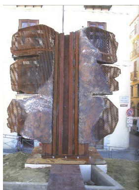
2008 - Cosenza, Piazza dei Valdesi La Vittoria di Samotracia , acciaio corten, resina, cm 280 x 200 x 70