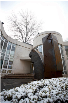
2010 - Pechino, Ambasciata Italiana in Cina Viandanti II , acciaio corten, cm 400 x 250 x 140