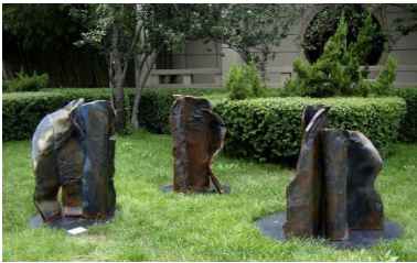
2010 - Pechino, NAMOC - National Art Museum of China Danzatrici , 3 elementi, acciaio corten, cm h 120