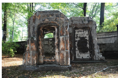
2007 - Milano, Corte dei Conti La porta della giustizia , ferro, gasbeton resinato, cm 420 x 225 x 285