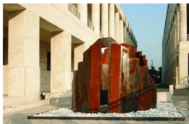
2006 - Roma, Archivio Centrale dello Stato Fortezza , ferro, cm h 220 x Ø 250

Europa-Italia (Roma, Milano, Cosenza, Loreto, Reggio Calabria, Varese), America (Denver, Miami) e Asia (Pechino, Shanghai, Jinan, Rongcheng - Shandong, Tianjin).