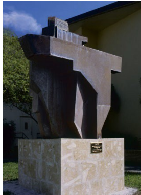
2011 - Miami, Corpus Christi Catholic Church - Sculpture Park Icaro , 2010, acciaio corten, cm 280 x 250 x 130