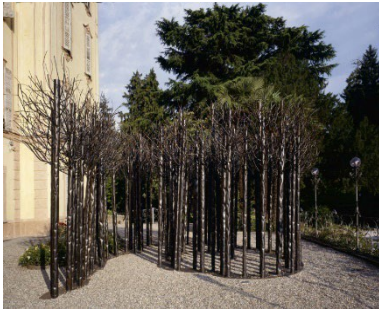
2013 - Varese, Villa Recalcati Bosco , 2012, 19 elementi, ferro, cm h 400 x 400 x 430