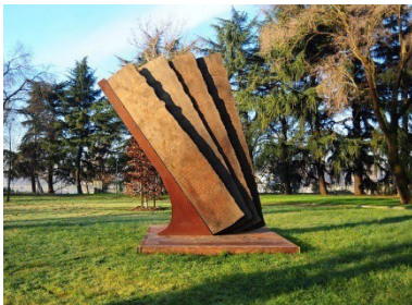
2015 - Milano, Parco dell'Arte all'Idroscalo Vento (in occasione di EXPO 2015), 2013, legno di recupero, acciaio corten, cm 430 x 300 x 100