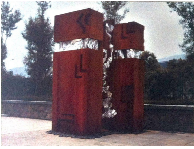
2010 - Jinan, Shandong University of Art and Design Legami III , acciaio corten, piombo, cm 350 x 250 x 460