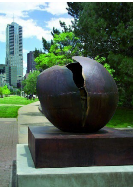
2010 - Denver, Auraria Campus Madre , 2009, acciaio corten, cm 170 x 200 x 200