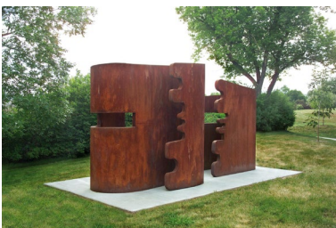
2010 - Denver, Rocky Mountain College of Art + Design Out & Inside , 2005, acciaio corten, cm 200 x 185 x 400